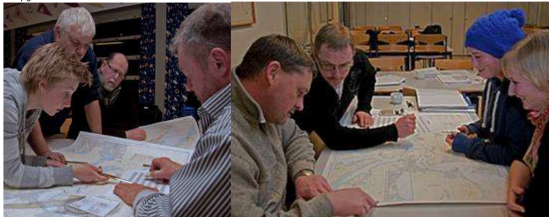
Sejladspanlægning, hold 1 og hold 2 arbejder koncentreret med at få styr på deres distance beregninger, fart og tid, hvor er fyrene og hvordan lyser de.

Alle der har sejlet ' rigtigt ' i mørke, ved at det kræver planlægning, så de efterfølgende undervisningsaftener blev brugt flittigt til opgaven.