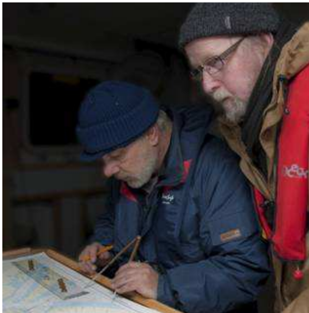
Der arbejdes ihærdigt ved kortbordet ombord på Partisan